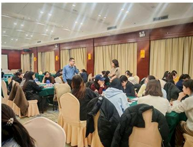
“经验交流面对面”活动现场